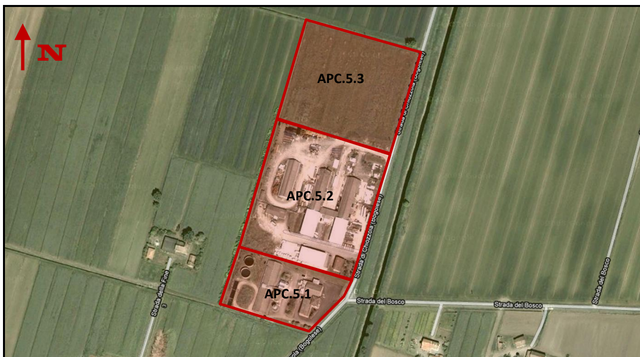
Individuazione dei Sub - Ambiti APC.5.1 – APC.5.2 – APC.5.3 - Ramoscello