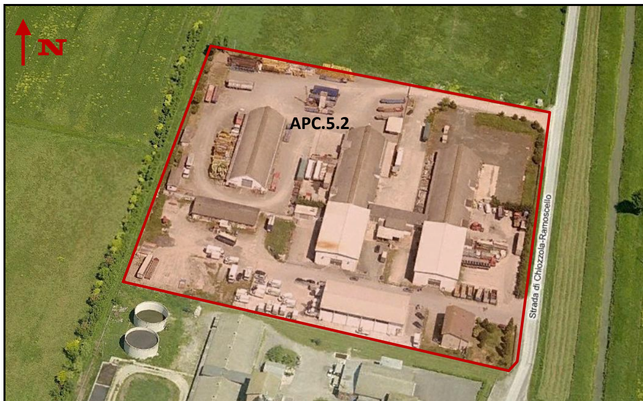
Individuazione del Sub - Ambito APC.5.2