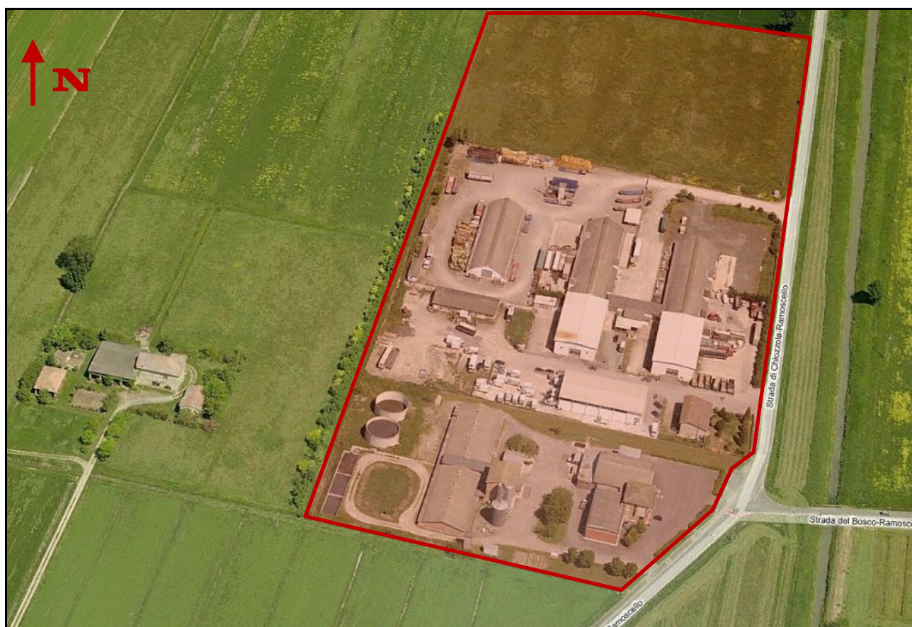
Individuazione dell'Ambito APC.5 - Ramoscello