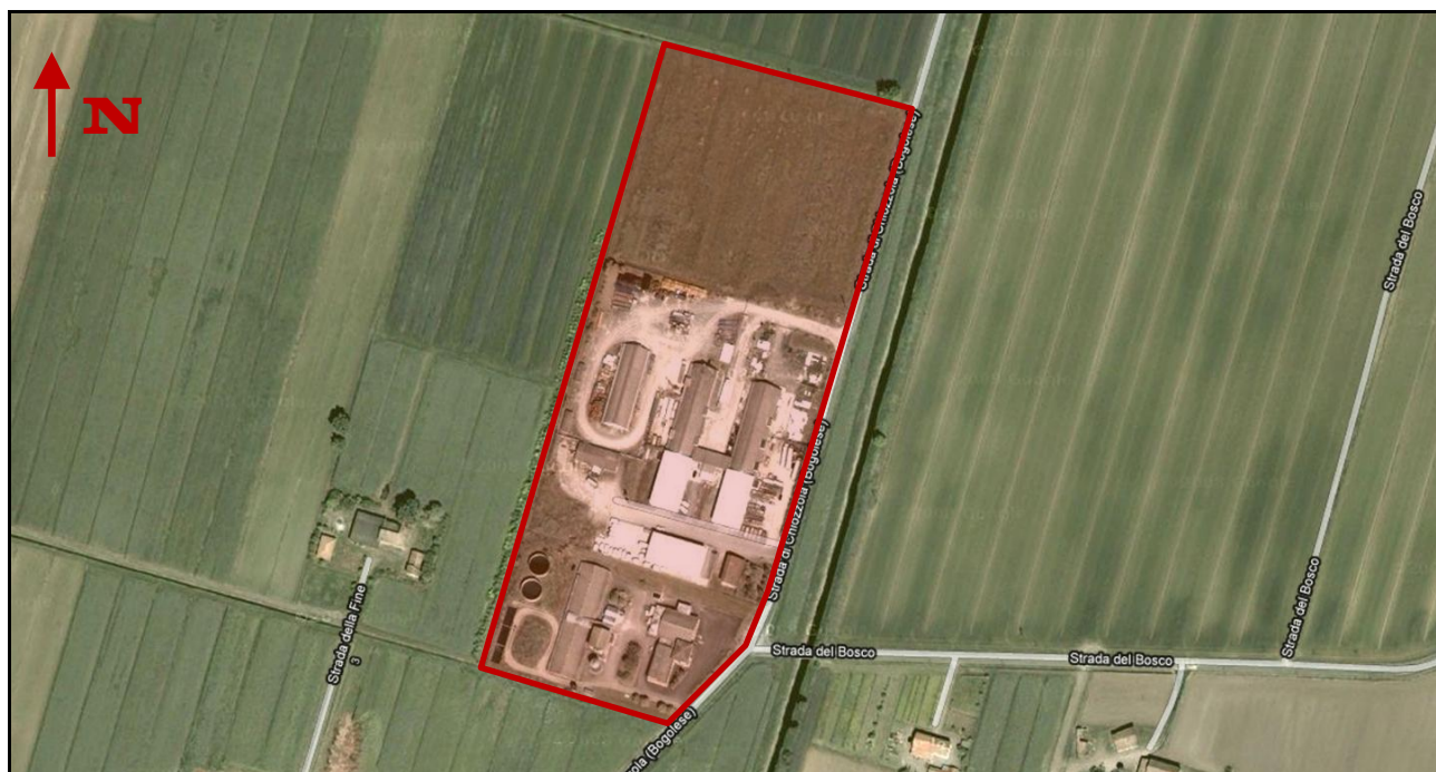
Individuazione dell'Ambito APC.5 - Ramoscello