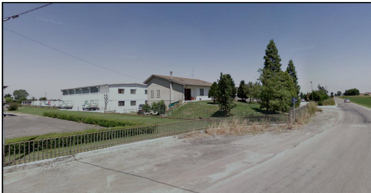
Vista da Sud del Sub - Ambito APC.5.2 Punto di vista da Strada di Chiozzola – Ramoscello