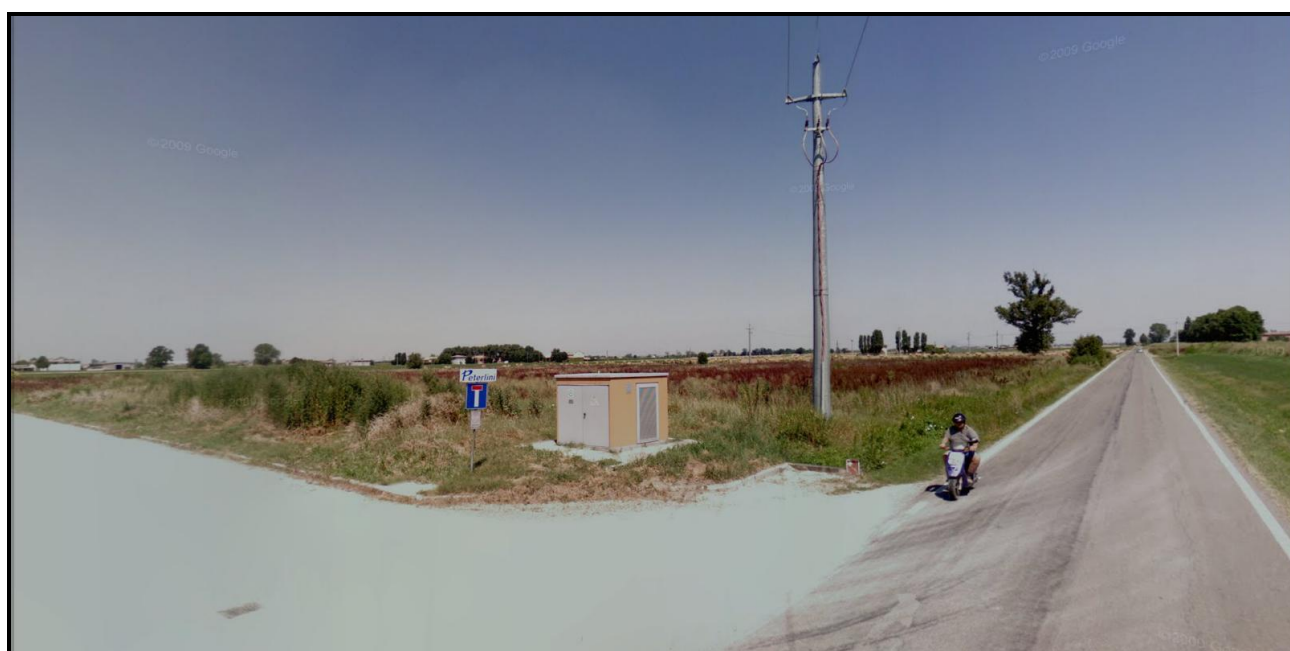
Vista da Sud del Sub - Ambito APC.5.3 Punto di vista da Strada di Chiozzola – Ramoscello