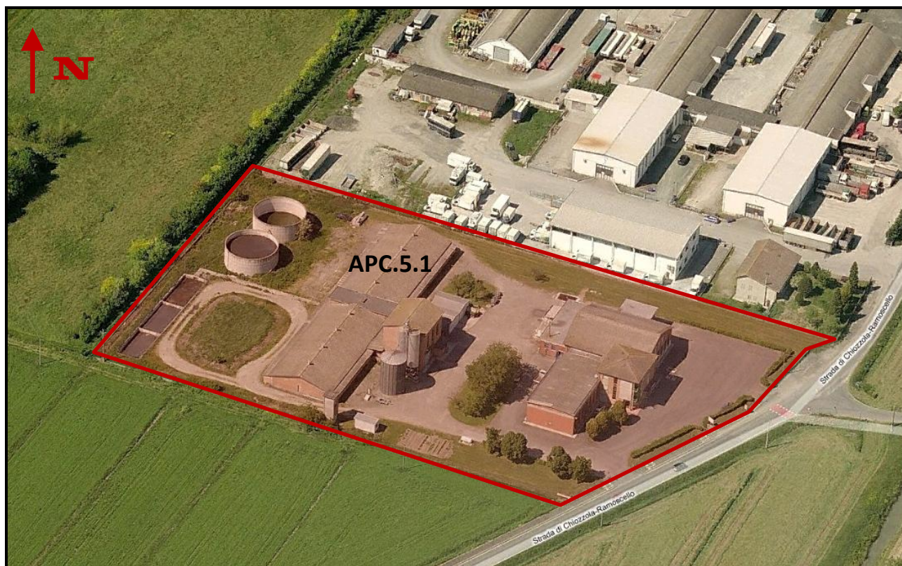
Individuazione del Sub - Ambito APC.5.1