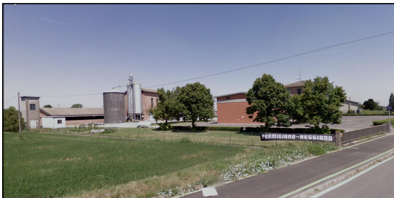
Vista da Sud del Sub - Ambito APC.5.1 Punto di vista da Strada di Chiozzola – Ramoscello