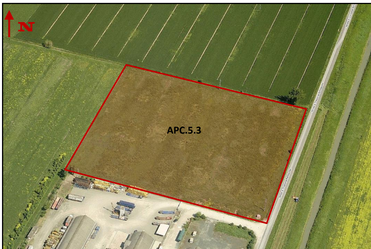
Individuazione del Sub - Ambito APC.5.3